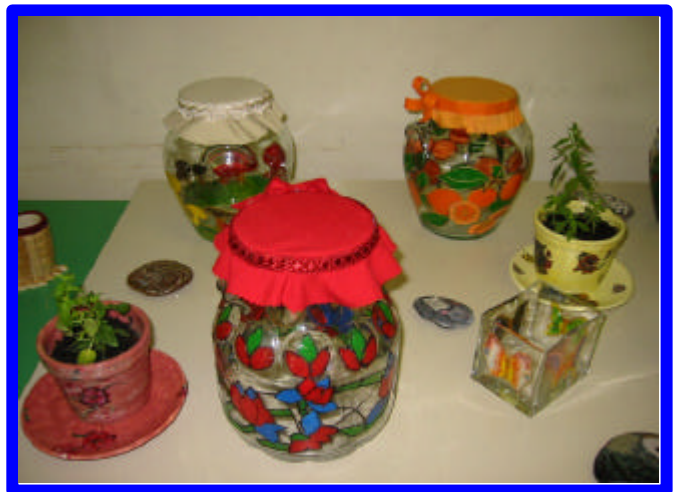
Classe 5 a Scuola primaria Montetorto

Quest'anno la scuola Montetorto lasceremo e molte cose rimpiangeremo. Ma le mostre non dimenticheremo, sempre nel cuore le porteremo. Sono state faticosissime, ma bellissime, la possibilità di scordarle sono bassissime. Noi ce le ricorderemo e per sempre fieri ne andremo! Di lavori ne abbiamo eseguiti tanti, e tutti entusiasmanti!!! Non siamo mica somarelli, noi ci sappiamo fare anche con gli acquerelli! Desideriamo che alle medie si ripetano queste attività, per divertirci anche là lavorando con creatività e in serenità.