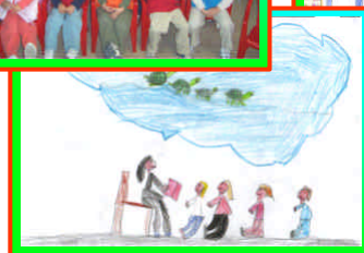
Scuola dell’infanzia, Passatempo