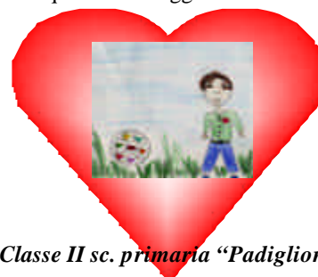
Classe II sc. primaria “Padiglione”

- Caro pallone ti regalerò al mio amico del cuore, per dare anche a lui questo messaggio d’amore -